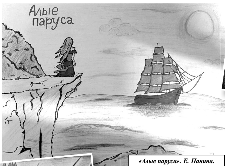
«Алые паруса». Е. Панина.