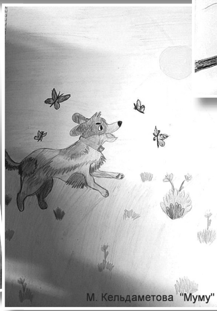
М. Кельдаметова «Муму»