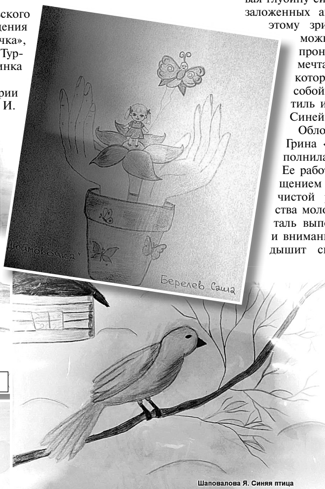
Берелев А.С. «Дюймовочка»