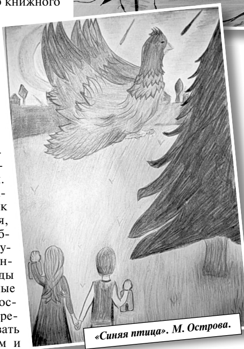
«Синяя птица». М. Острова.