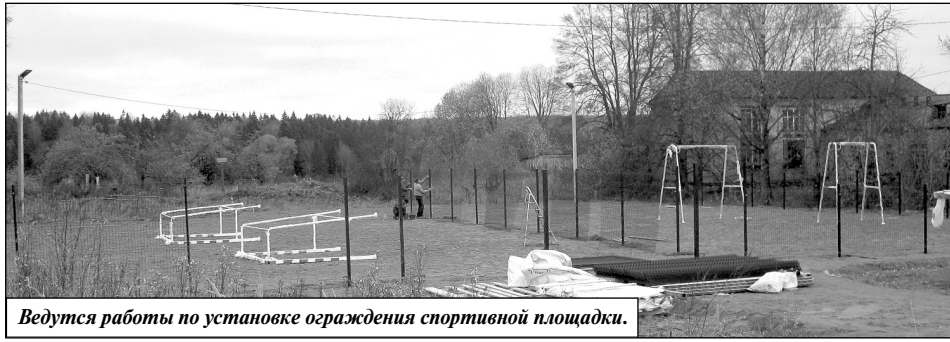
Ведутся работы по установке ограждения спортивной площадки.