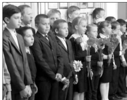
Учащиеся Извольской основной школы на торжественной линейке.

кончились его «школьные годы чудесные», а впереди - экзамены и выбор дальнейшего жизненного пути.