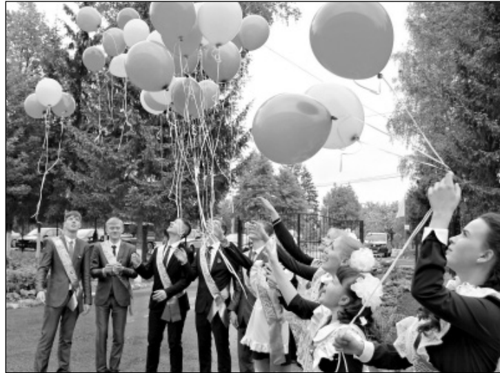
Шары с мечтами и пожеланиями выпускников устремляются в небо.