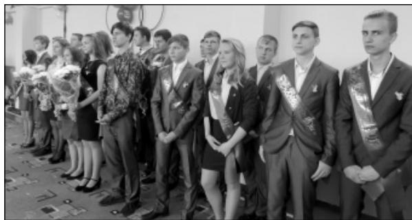
Выпускники 9 класса на торжественной линейке.

Она отметила, что текущий учебный год в школе завершили 11 учащихся 11 класса и двадцать пять учащихся 9 классов и что все они допущены к государственному экзамену.