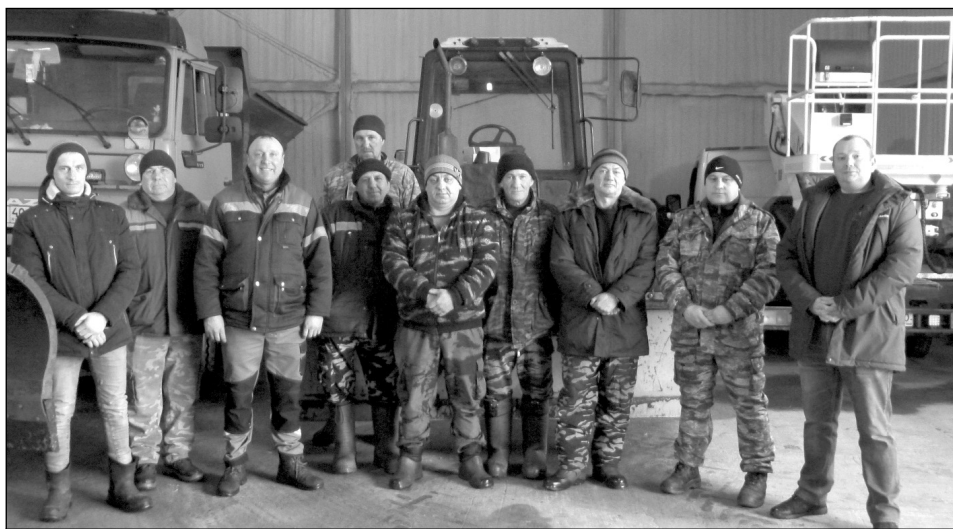
Мужской коллектив МУП «Калужский лес».