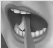
2. Внутренние поверхности зубов