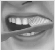
1. Наружные поверхности зубов