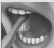
4. Жевательные поверхности зубов