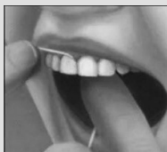
6. Зубная нить