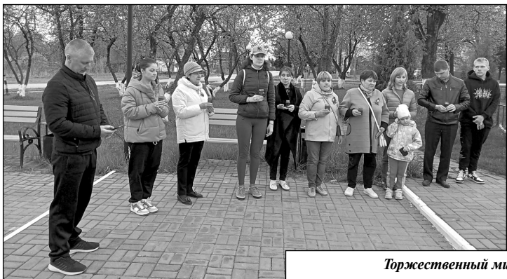
Торжественный митинг в сквере Памяти.