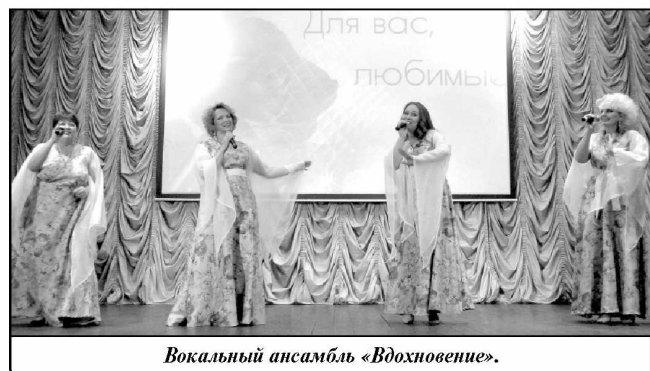
Вокальный ансамбль «Вдохновение».