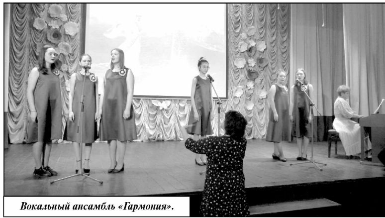
Вокальный ансамбль «Гармония».