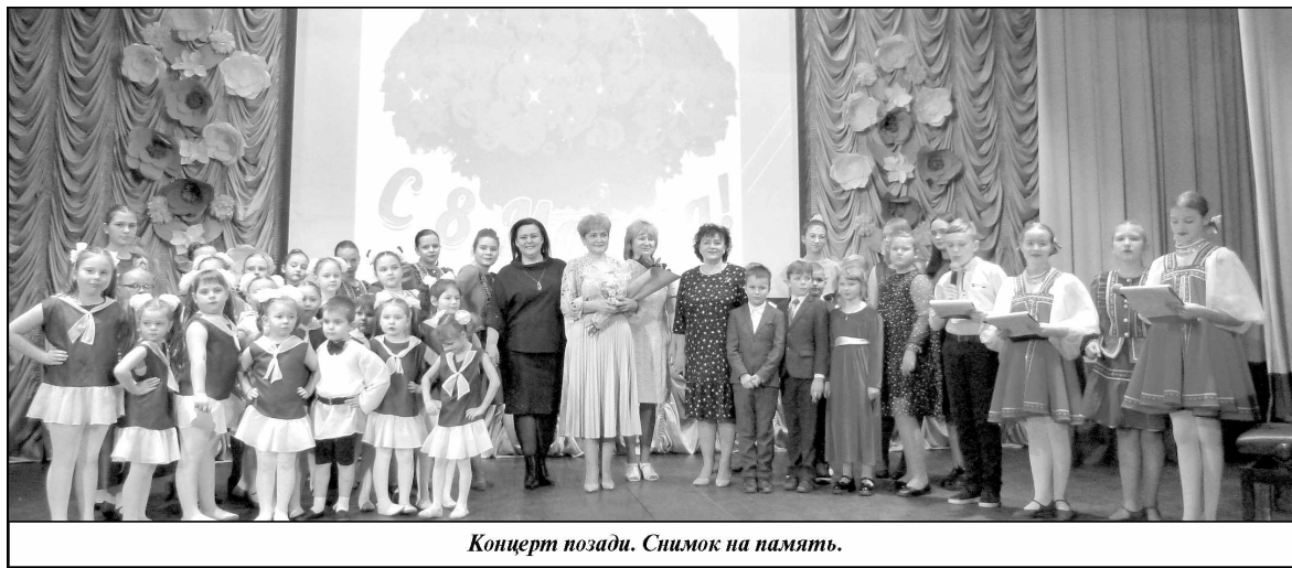
Концерт позади. Снимок на память.

Украшением концерта под названием «Праздник мамы - значит, Весна!» стало выступление артистов хореографического ансамбля «Серпантин». Танец «Подруженьки», «Износковские девочки», «Неаполитанская тарантелла», «Татарский сабантуй» и «Попурри русского танца» по-