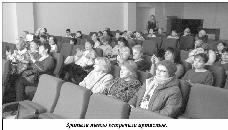
Зрители тепло встречали артистов.