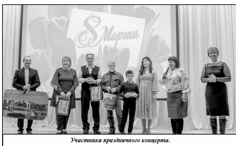
Участники праздничного концерта.

От всей души желаю прекрасным женщинам, чтобы каждый день их жизни был таким же, как этот замечательный весенний праздник: полным признательности и уважения, любви и нежности,