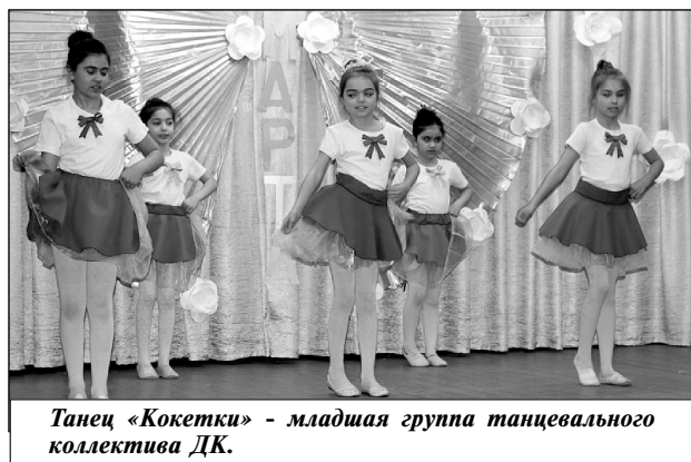
Танец «Кокетки» - младшая группа танцевального коллектива ДК.