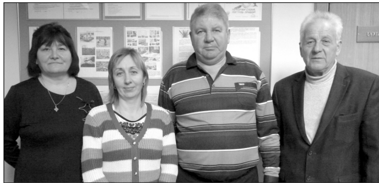
Коллектив отдела строительства и жилищно-коммунального хозяйства администрации МР «Износковский район».

не так заметна, как труд людей, непосредственно занятых вопросами коммунального хозяйства. Это работники отдела строительства и жилищно-коммунального хозяйства администрации МР «Износковский район».