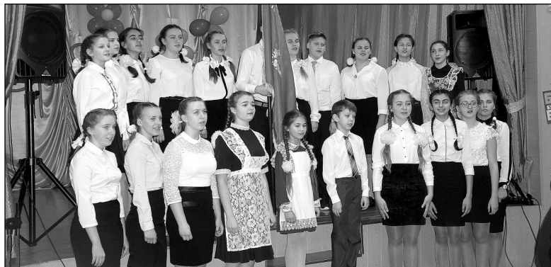
Выпускников приветствует школьный хор.