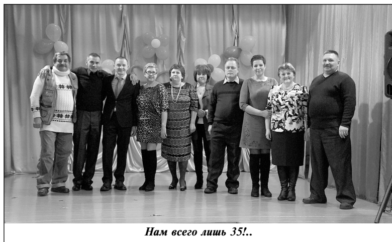
Нам всего лишь 35!..

Пресс-центр МОУ «Мятлевская СОШ им. А.Ф. Иванова».