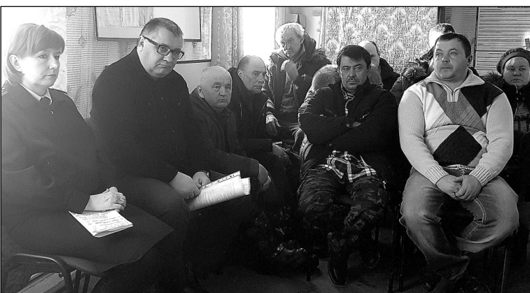
В зале собрания во время отчетного доклада.