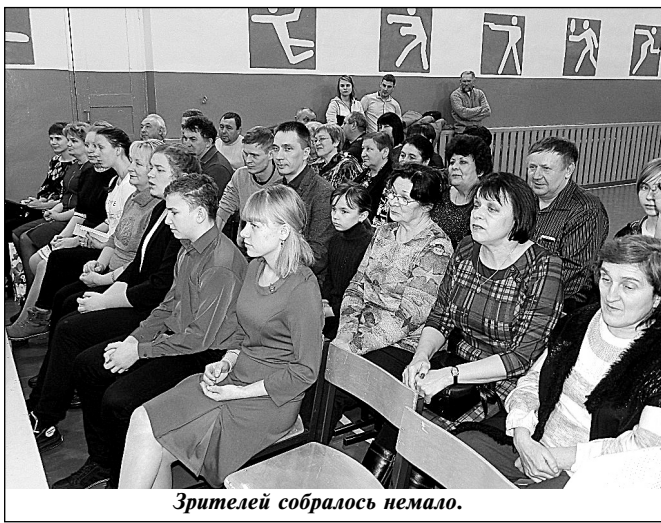
Зрителей собралось немало.