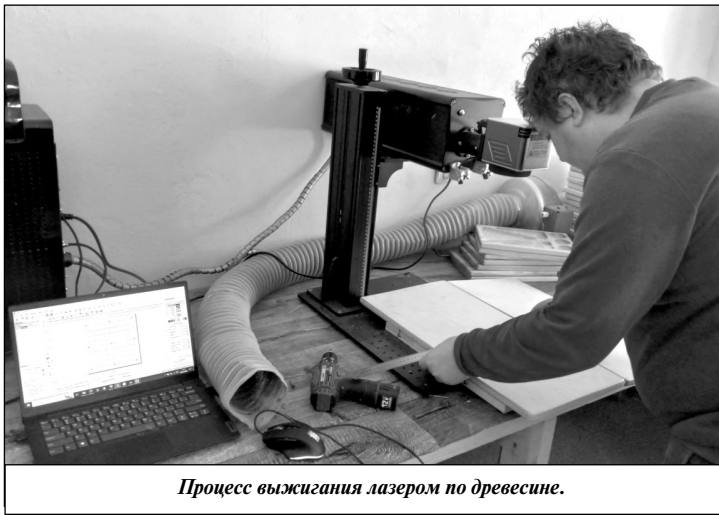
Процесс выжигания лазером по древесине.

Многие наши читатели наверняка помнят такое увлечение из детства, как художественное выжигание по дереву. Простые электрические приборы с нагревательным элементом из проволоки были, пожалуй, во всех Дворцах пионеров, в кружках детского творчества. С их помощью талантливые дети (да и взрослые) умудрялись создавать целые картины на древесине. Лазерный маркиратор, по своей сути,