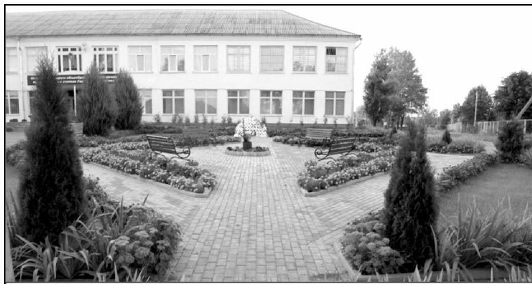
На пришкольном участке Мятлевской средней общеобразовательной школы им. А.Ф. Иванова.

Задача данного проекта - внедрение в российских школах новых методов обучения и воспитания, современных образовательных технологий, оснащение оборудованием для внедрения новых методов изучения таких предметов, как математика, информатика, технология, физ-