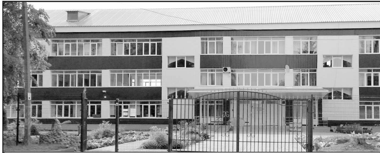
Так выглядит сегодня Износковская средняя общеобразовательная школа.

В МОУ «Мятлевская СОШ им. А.Ф. Иванова» будет отремонтировано три класса, в которых также будет располагаться по 15 инфраструктурных мест. Дополнительное образование здесь предусматривает такие направления, как флористика, биотехнология. Флористика как дополнительное образование здесь была выбрана не случайно. На протяжении ряда лет в Мятлевской школе воспитывают художественный вкус, учат ребят видеть прекрасное рядом и уметь создавать