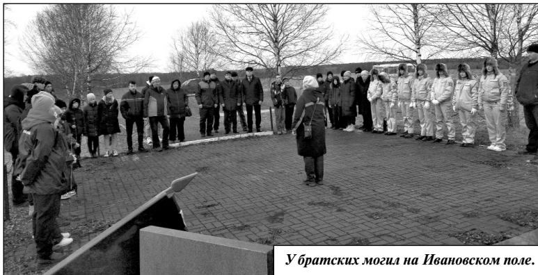
У братских могил на Ивановском поле.

– Годы идут, а память о священном подвиге русского солдата, от-