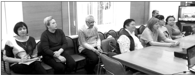
Последнее в этом году заседание сельской думы села Износки было посвящено публичным слушаниям по проекту решения о бюджете на 2020 год и плановый период 2021-2022 гг.