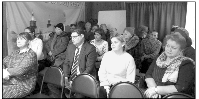
В зале собрания.

В 2022 году сельской администрацией в рамках программы министерства финансов Калужской области «Реализация про-