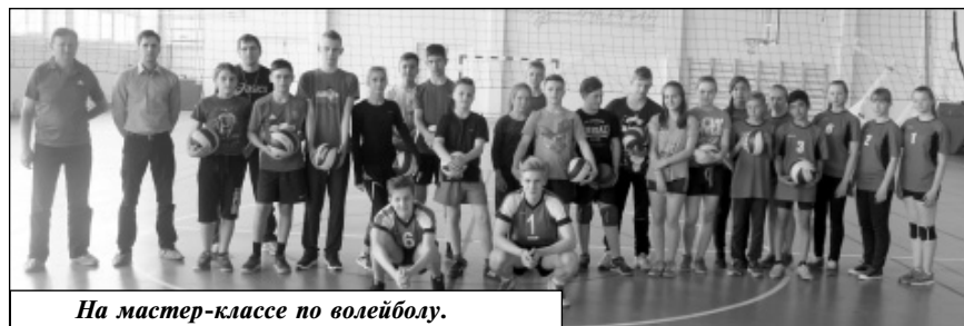
На мастер-классе по волейболу.

части населения - футбол. Без преувеличения, каждый день, в выходные и праздники, в любую погоду до позднего вечера на футбольном поле идут тренировки и упорные поединки. Школьный стадион, уличный тренажерный комплекс, атлетический и спортивные залы - всё к услугам приверженцев здорового образа жизни. Участие в массовых спортивных соревнованиях, спортивно-туристических слетах, праздниках, на наш взгляд, в значительной степени способствует вовлечению детей и взрослых в занятия спортом. Так, мы стали постоянными участниками областных соревнований «Лыжня России» и «Кросс нации», осваиваем Всероссийский спортивный комплекс «Готов к труду и обороне». Важно, чтобы дети и взрослые понимали, что здоровье человека - это огромная ценность, и от того, насколько человек ведет активный образ жизни, зависит качество его собственной жизни.