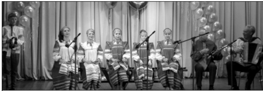
Выступает ансамбль «Износковские ложкари».