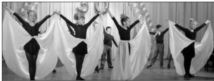
«Испанский этюд» в исполнении танцевального ансамбля «Серпантин».