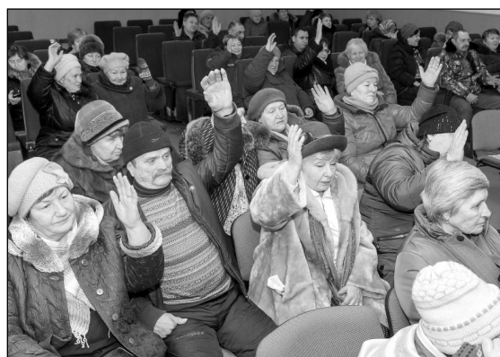
Участники собрания единогласно поддержали предложение о положительной оценке работы администрации МО СП «Поселок Мятлево» за 2018 год.

Успешно справляется со своими задачами и коллектив работников Дома культуры. За год ими проведено 107 мероприятий всех форм. Работают шесть клубных формирований, действуют любительские объединения и клубы по интересам. При проведении массовых мероприятий всегда отработан сценарий, привлекаются все новые участники художественной самодеятельности. В период летних каникул для детей были организованы игровые программы, конкурсы, дискотеки, викторины - всего 35 мероприятий. Не давали скучать детворе и в период зимних каникул. В Рождество для детей была организована встреча с настоятелем храма в честь иконы Божией Матери «Всех скорбя-