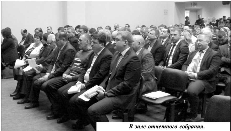
В зале отчетного собрания.

В 2018 году правительством Калужской области на капитальные ремонты четырех школ района было выделено 20 млн. руб. Благодаря этому был решен ряд многолетних проблем. Говорю об этом не как об одноразовой акции, а как о той поддержке, за которую мы крайне благодарны и которую мы испытываем со стороны регионального правительства на протяжении последних лет. Без этой поддержки, даже при самом благоприятном экономическом эф-