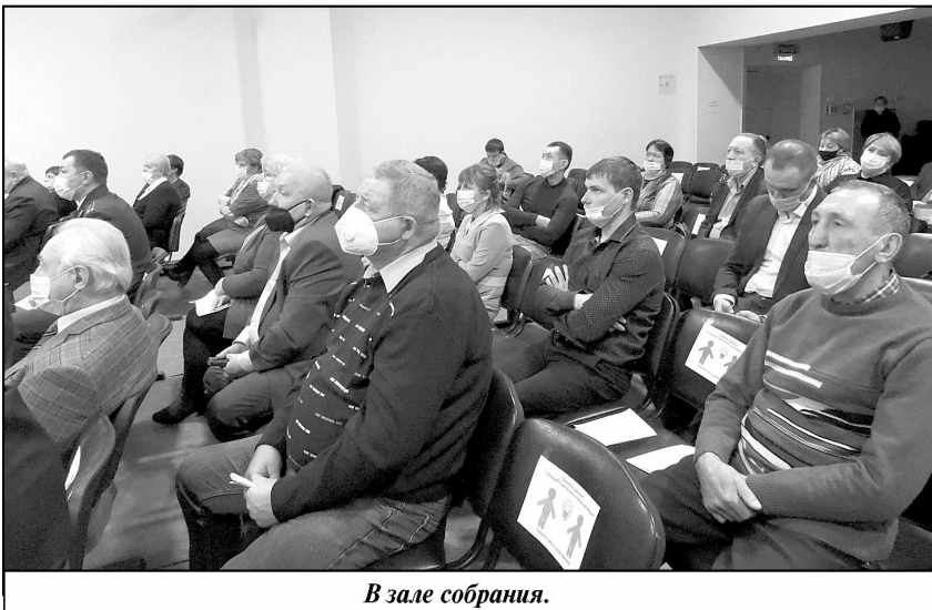
В зале собрания.

Так, по инициативе администрации района в июле 2021 года министерством дорожного хозяйства совместно с министерством сельского хозяйства Калужской области принято решение о предоставлении в Федеральное дорожное агентство заявочной документации в целях конкурсного отбора и включения в перечень мероприятий по развитию транспортной инфраструктуры реконструкции автомобильной дороги Износки-Ивановское протяженностью 12,310 км, но только при условии прохождения процедуры конкурсного отбора проекта «Комплексного развития д. Ивановское» на 2024 год. Администрацией района начаты работы по проектированию объектов для включения в программу и продолжено привлечение инвесторов на данную территорию. Кроме того, в текущем году министерством дорожного хозяйства Калужской области начато проектирование объекта реконструкции автомобильной дороги Мятлево-Городенки протяженностью 9,6 км для включения данной автомобильной дороги в перечень мероприятий по развитию транспортной инфраструктуры до предприятия « Селекционный центр аквакультуры » с их финансовым участием в строительстве данного объекта в 2023-2024 годах.