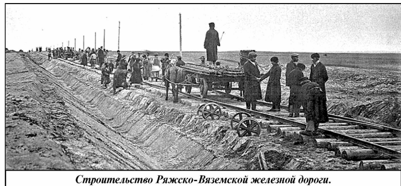
Строительство Рязско-Вяземской железной дороги.

насыпи. Землю подвозили конные подводы с возчиками. Деревянные шпалы пропитке не подвергались. Рельсы были различной длины - от 5,6 до 6,5 метров, весом по 26 килограммов метр. Часто шпалы и рельсы укладывались прямо на земляное полотно, без подсыпки щебня.