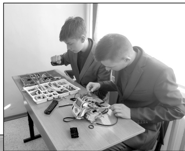
На занятиях по робототехнике.

Педагоги школы надеются, что каждый учащийся, посещая «Точку роста», найдет занятие по душе,