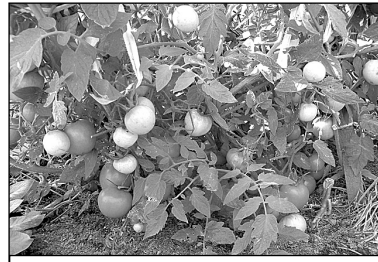
Овощ вкусный - помидор.