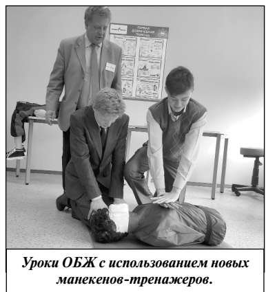
Уроки ОБЖ с использованием новых манекенов-тренажеров.

Сегодня мы не просто открываем классы после ремонта. Эти помещения наполнены самой новой техникой, которой учителя уже смогли овладеть. Теперь они научат вас! Авиамоделирование, робототехника, проектирование,