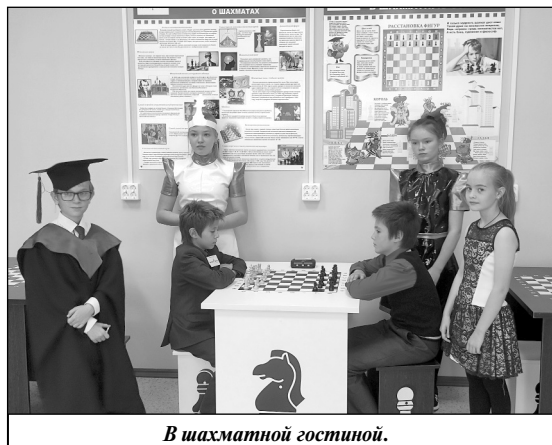
В шахматной гостиной.