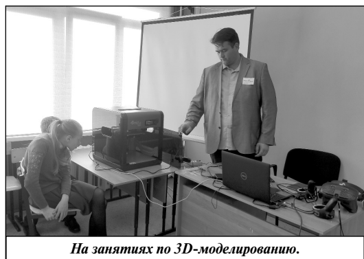
На занятиях по 3D-моделированию.

Новые площадки позволяют учащимся совершенно по-иному изучать такие предметы, как ОБЖ, технология и информатика. Изменилась подача и содержание этих дисциплин. Так, например, навыки оказания первой медицинской помощи ученики теперь отрабатывают на манекенах, для получения практических умений по технологии в распоряжении ребят фрезерные станки и