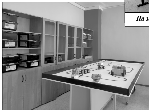
На занятиях по робототехнике.

Также в рамках нацпроекта закуплены цифровое и компьютерное оборудование, интерактивные комплексы, манекены для отработки навыков оказания доврачебной помощи, инструменты и фрезерные станки для уроков технологии, наборы робототехники и современные конструкторы. Кроме того, в школе появился квадрокоптер, шлем вир-