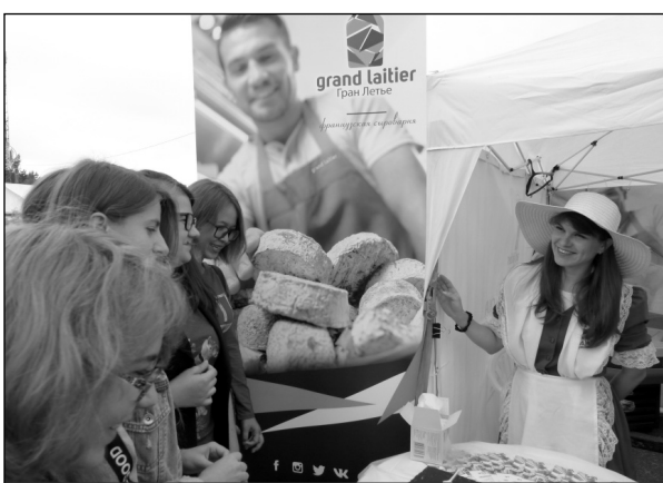
Возле торговой палатки французской сыроварни «Гран Летье» желающих приобрести продукцию было немало.

можно было даже попробовать на радость посетителям. Фрукты на выставке были представлены ООО «Мелето».