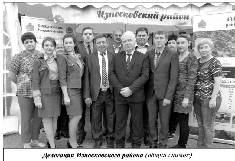
Делегация Износковского района (общий снимок).

шественные ИП КФХ «Капаларан Д.С.», ИП КФХ «Максимович А.Д.», а также молоко от сельскохозяйственных предприятий СХПК «Холмы» и АПК «Извольский», которые вместе с ООО «Агрофирма «Шанский Завод» представили на выставку и культуры со своих полей: овес, пшеницу, рапс, пелюшку и т.д. Красоту нашему павильону добавили декоративные растения, представленные агрофирмой 2PLANTS. Большой интерес у всех заинтересовавшихся продукцией Износковского района вызвали грибы шампиньоны и вешенки - как сырые, так и маринованные, которые