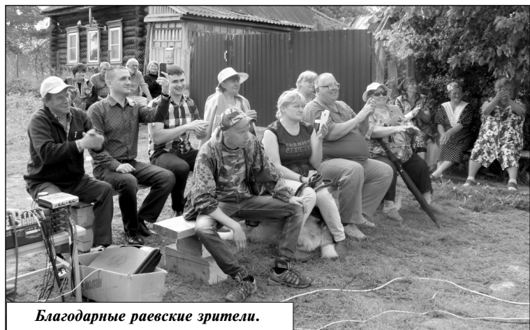
Благодарные раевские зрители.