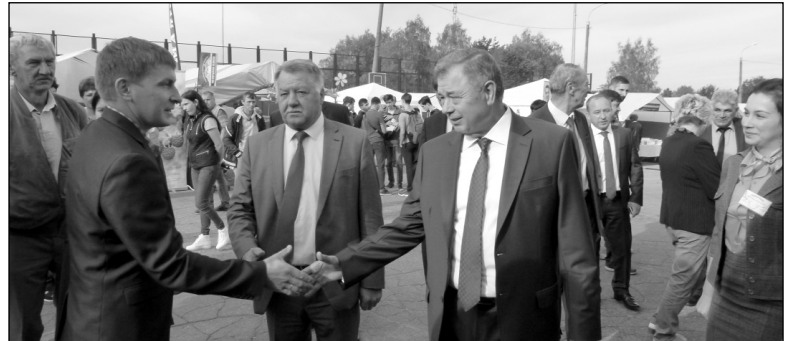
У выставочного павильона Износковского района губернатора Калужской области А.Д. Артамонова встречал начальник отдела сельского хозяйства администрации МР «Износковский район» Е.М. Васильев.

Как и всегда, уже традиционно губернатор Калужской области А.Д. Артамонов и министр сельского хозяйства Калужской области Л.С. Громов посетили каждый выставочный