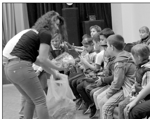
Подарки от команды добра.