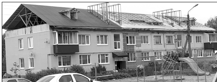
Ремонт многоквартирного дома № 2а по ул. Новая проводится за счет взносов собственников жилья в фонд капитального ремонта.

Согласно части третьей, статьи 158 жилищного кодекса Российской Федерации, обязанность по оплате расходов на капитальный ремонт многоквартирного дома распространяется на всех собственников помещений в этом доме с момента возникновения права собственности на помещения в этом доме. При переходе права собственности на помещение в многоквартирном доме к новому собственнику переходит обязательство предыдущего собственника по оплате расходов на капитальный ремонт многоквартирного дома, в том числе не исполненная предыдущим собственником обязанность по уплате взносов на капитальный ремонт.