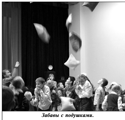
Забавы с подушками.