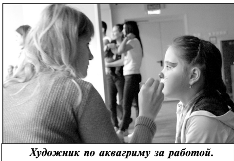
Художник по аквагриму за работой.

командной игре наматывать разноцветную ленту, чеканить на матерчатом «небе» разноцветный мяч или побывать в центре большого мыльного пузыря, пе-