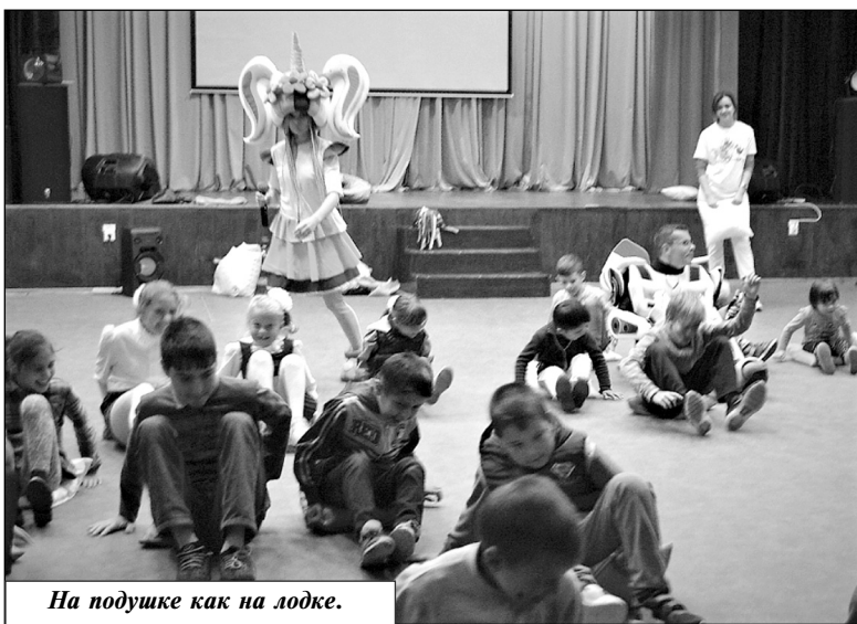
На подушке как на лодке.