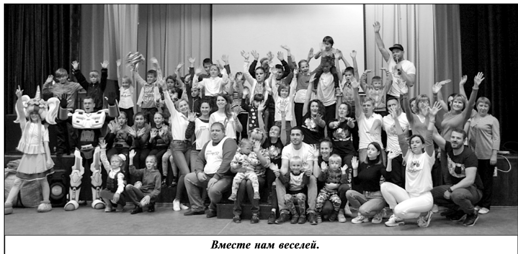
Вместе нам веселей.