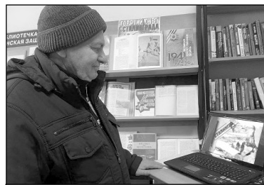
Читатели Износковской районной библиотеки на слайд-беседе «Горькой памяти глоток».