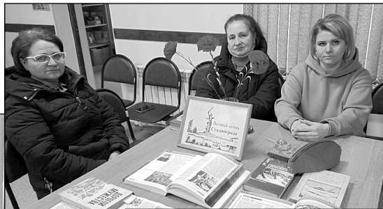
Читатели Извольской библиотеки на часе информации «Не ради славы и наград герои защищали Сталинград».