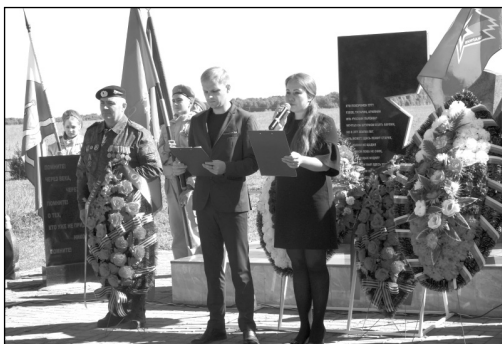
На мемориале «Ивановское поле» прошли памятный митинг и церемония перезахоронения останков 129 красноармейцев, найденных в ходе Вахты Памяти-2022.

К сожалению, вместе с останками не были обнаружены какие-либо удостоверяющие личность документы, а содержимое найденных медальонов не сохранилось. Таким образом, братское захоронение, в котором до этого года уже покоилось почти четыре тысячи человек, пополнилось еще 180 безымянными героями. Теперь на «Ивановском