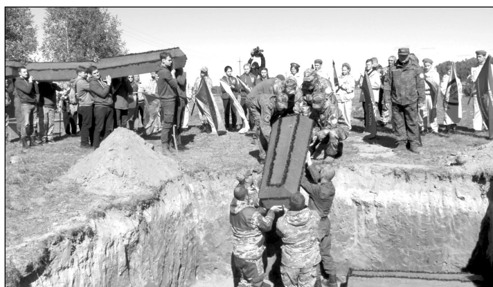
Поднятых из земли солдат проводили в последний путь со всеми воинскими и церковными почестями.