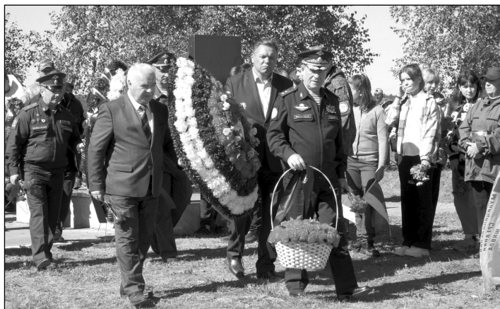
На свежую могилу взрослые и дети возложили венки и живые цветы.