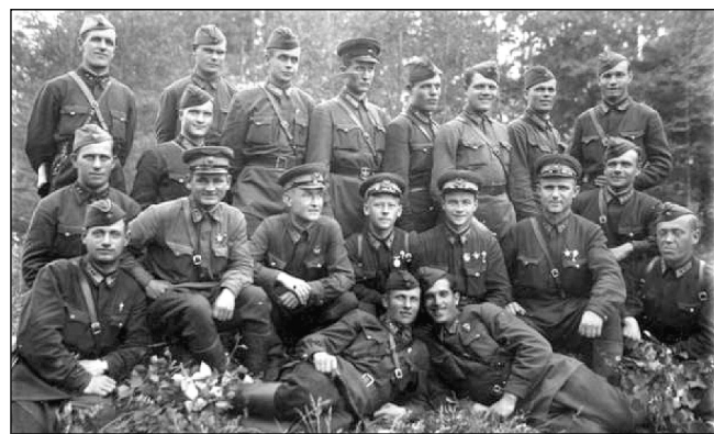
Воины 201-й воздушно-десантной бригады на переформировании в г. Раменское.

Части 17-й стрелковой дивизии остаются на прежних позициях, укрепляют занятые рубежи, местами ведется разведка боем. Действуют разведотряды и разведгруппы от штаба 43-й армии. Уничтожена группа разведчиков противника.