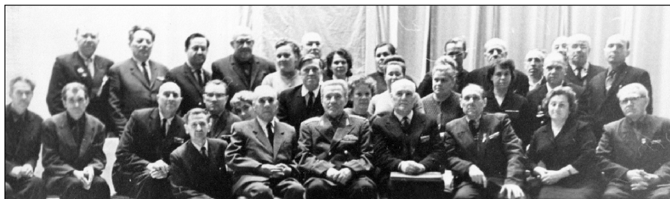
25 лет разгрома фашистских войск под Москвой. Ветераны 17-й стрелковой дивизии. 29.11.1966 г. Москва.

23.00 части 17-й стрелковой дивизии переходят к выполнению боевого приказа № 043 от 1.02.1942 г. Для предотвращения прорыва противника на север и северо-запад на участке Ухово - Дороховая 17-я стрелковая дивизия с отдельным стрелковым полком западного фронта сменяет там 18-ю стрелковую бригаду и переходит к обороне на рубеже д. Ухово, Дороховая, Аксеново, высота 206,3, д. Леоново.