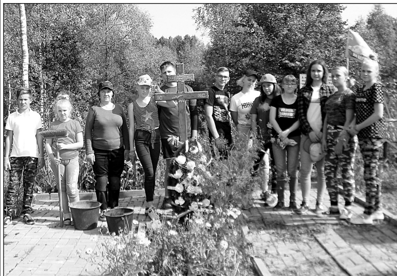
Краеведы и юнармейцы Износковской школы в деревне Новые Клины.

ей Новых Клинов, соседних деревни и любимая многими гречневая каша с тушенкой, разные вкусности из дома. Мы все знали, что вечер будет долгим. Вспоминали события военных лет, происходящие на износковской земле и в районе деревни Клины, о которых мы узнали из материалов школьного музея, на уроках истории и краеведения. Разговор у нас на выездных мероприятиях идет по своим законам: каждый сидящий у костра человек, будь то школьник или взрослый, должен обязательно участвовать в «кольцовке» воспоминаний, историй, стихов и военной песни. Некоторые ребята готовятся к таким вечерам заранее. Все мы по очереди рассказывали военные истории, многие из них были из жизни родственников. Пели военные