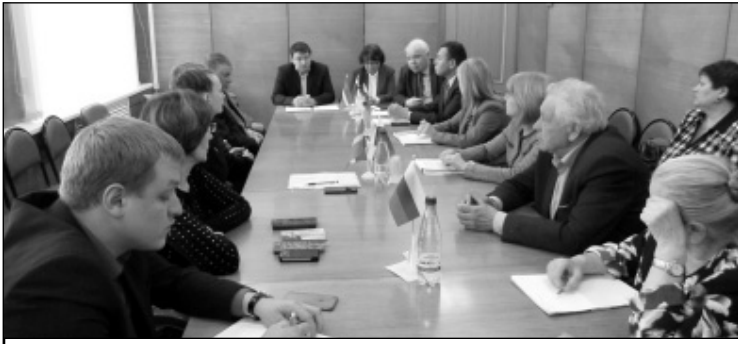
Общественный совет района за круглым столом.

О состоянии дел в учреждениях культуры Износковского района, о том, какие