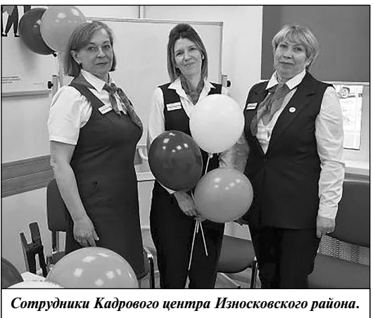
Сотрудники Кадрового центра Износковского района.

В 1991 году был принят Закон «О занятости населения в РСФСР».