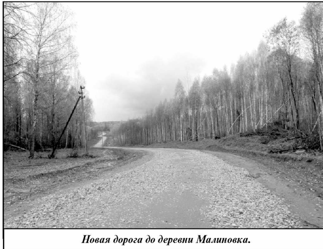
Новая дорога до деревни Малиновка.

— Мои родители всю жизнь жили в Малиновке, здесь прошло мое детство. Как толь-