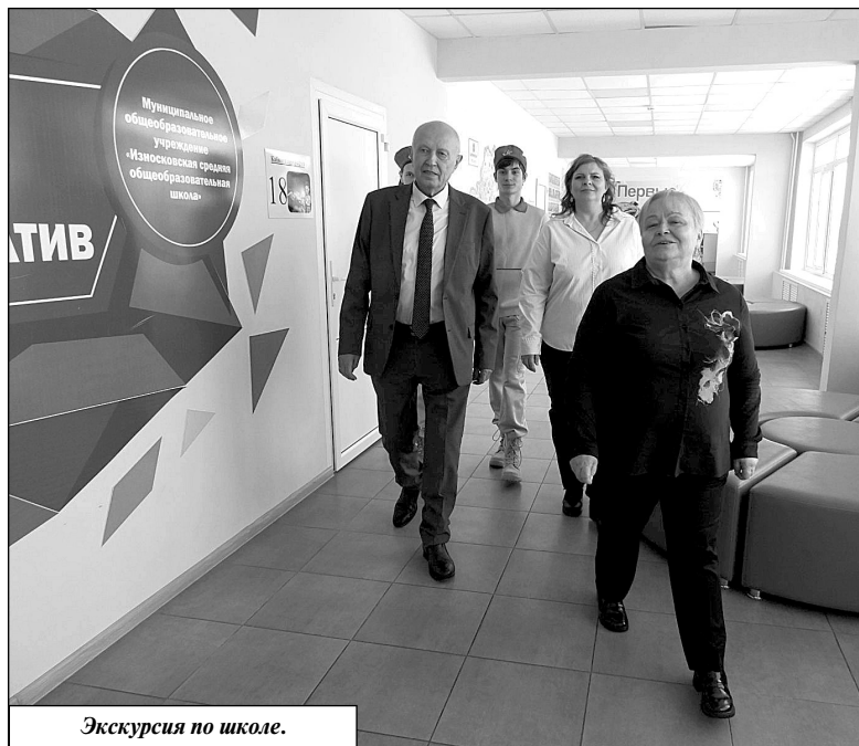
Экскурсия по школе.