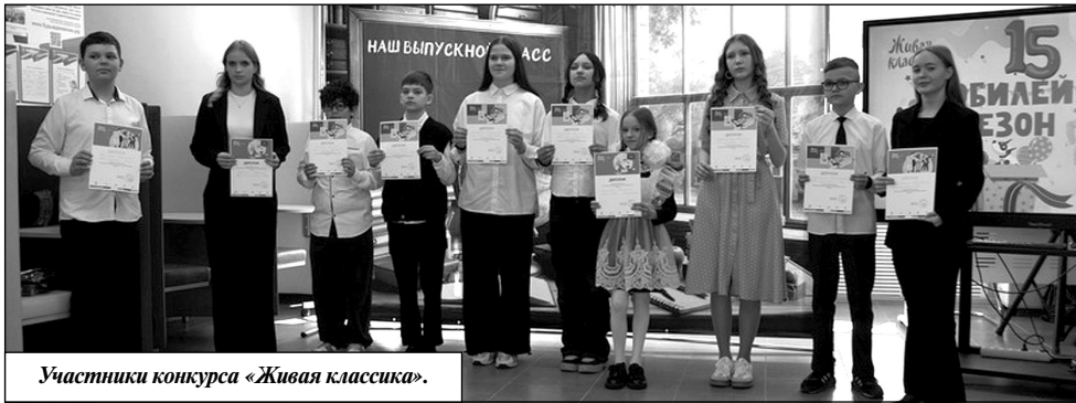
Участники конкурса «Живая классика».

Участники представили на суд зрителей и жюри такие произведения, как: