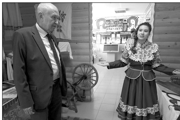
Знакомство с музейной экспозицией о быте и традициях народов России.