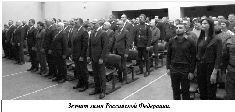
Звучит гимн Российской Федерации.

ю и запуск в работу газопоршневых установок мощностью 1,6 МВт каждая. Цель проекта — выработка электроэнергии ГПУ из природного газа, разрабатывается проект тепличного комплекса на базе выработанной электрической и тепловой энергии ГПУ. Также идет проработка развития произ-