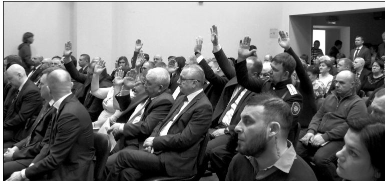
Депутаты районного Совета приняли отчет единогласно.

В рамках Национального проекта «Демография» проводился