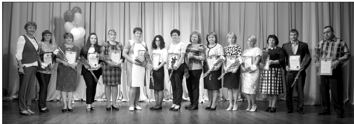
Педагогические работники, удостоенные Почетной грамоты районного отдела образования.