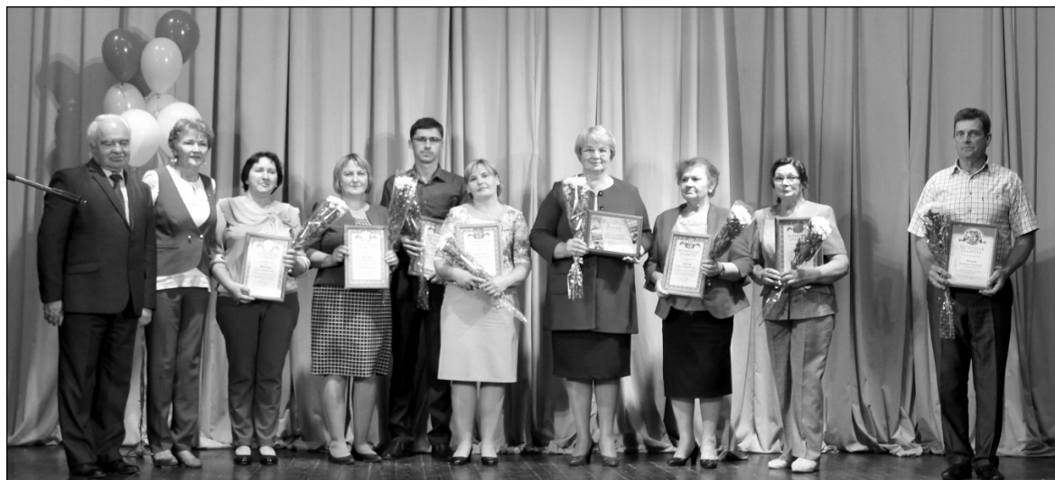
Учителя Износковского района, награжденные Почетной грамотой администрации района.