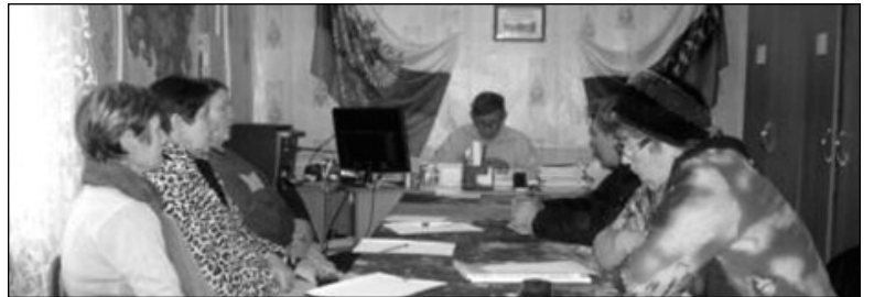
Идет заседание сельской думы МО СП «Деревня Михали».

щение улиц в Михалиях, и обустройство детской площадки, и поддержание состояния дорог внутри поселения, и мероприятия, направленные на уборку жителями придомовых территорий.