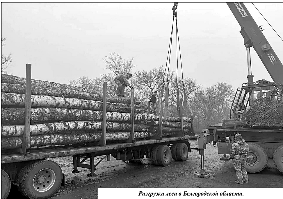
Разгрузка леса в Белгородской области.