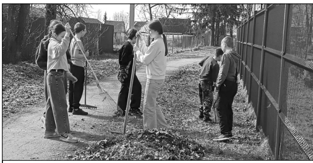
Учащиеся Износковской средней школы.

работ ложится на коммунальные предприятия округа – МАУ «Калужский лес» и МАУ «Мятлевское». Именно эти компании проводят все необходимые мероприятия по санитарному содержанию: уборку общественных территорий, а также улиц райцентра и поселка Мятлево; механизированную санитарную очистку дорог и тротуаров от песка и пыли, иные работы.