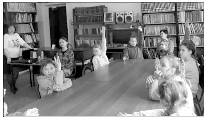
Первоклассники отвечают на вопросы по сказкам.

народов России». Ребята познакомились с бытом и традициями ительменов — малочисленного народа Камчатки. Прочитанная сказка «Бескрылый гусёнок» стала поводом для важного разговора о добре, дружбе и взаимопомощи. В конце встречи дети с удовольствием делились впечатлениями, обсуждая услышанное.