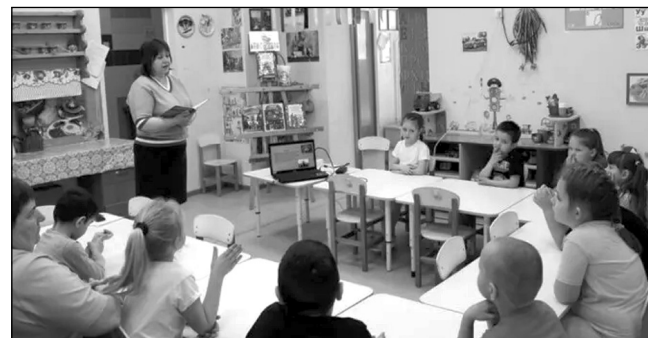
Со сказками народов России знакомятся дошкольники детского сада «Солнышко».

Для первоклассников Износковской школы прошла экскурсия, открывшая для них два волшебных мира библиотеки: шумный и гостеприимный абонемент, откуда книги отправляются в путь вместе с читателями, и тихий читальный зал — гавань для тех, кто хочет остаться с историей наедине. Юные гости узнали, как важно бережно относиться к книгам, и пообещали стать для них не просто читателями, а настоящими друзьями.