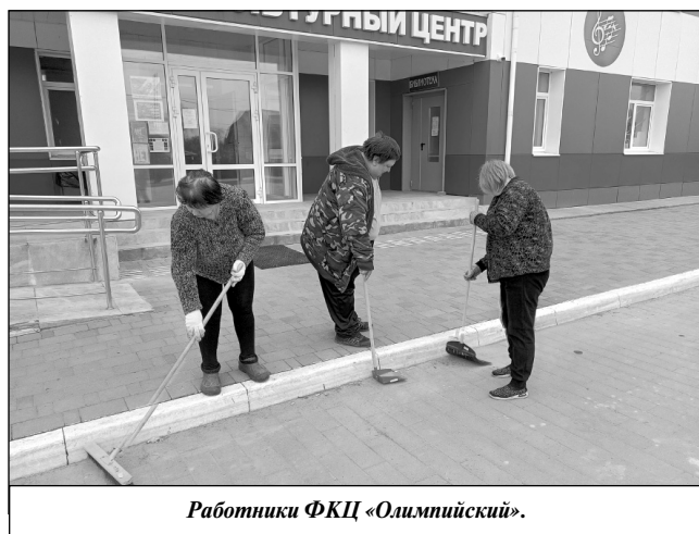
Работники ФКЦ «Олимпийский».