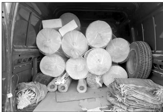
Компания «Лига - Регион» передала нашим бойцам укрывные материалы.