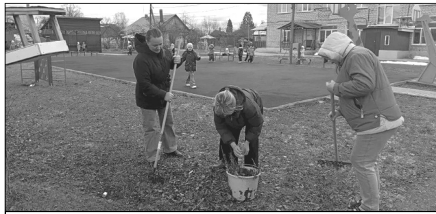
Сотрудники Мятлевского детского сада.

Напоминаем, что месячник благоустройства продлится по 5 мая. А до этого, 17 апреля, стартует Всероссийская акция «Вода России», инициированная в рамках национального проекта «Экологическое благополучие». В этот день в Износках с 10:00 пройдет субботник