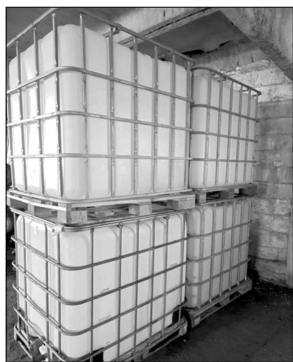
Четыре емкости под воду от Д.С. Козлова.

нужными для выживания вещами в зону СВО «едут» тёплые слова поддержки от юных земляков. Там, на линии огня, они очень нужны нашим бойцам. Школьники вместе со своими наставниками собирают посылки и пишут теплые письма, рисуют рисунки для наших солдат. Маленькие треугольные конвертики трогают сердце, напоминая о военном времени. Кроме того, дети наравне со взрослыми плетут маскировочные сети и заливают окопные свечи. В больших масштабах эта работа налажена в Мятлевской средней школе им. А.Ф. Иванова, которая напрямую сотрудничает с региональным отделением проекта «Народная сеть». Изготовленные сети для дальнейшей доставки на передовую учеб-