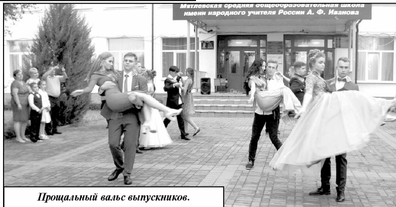
Прощальный вальс выпускников.