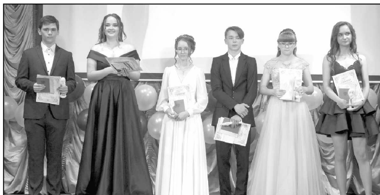
Выпускники 2021 года Износковской средней школы уже с аттестатами в руках.

Родители выпускников подготовили видеоролик в котором прослеживалась жизнь их детей с первого дня учебы в школе и до ее окончания. Это учеба, родительские собрания, вечера, праздники, спортивные соревнования,