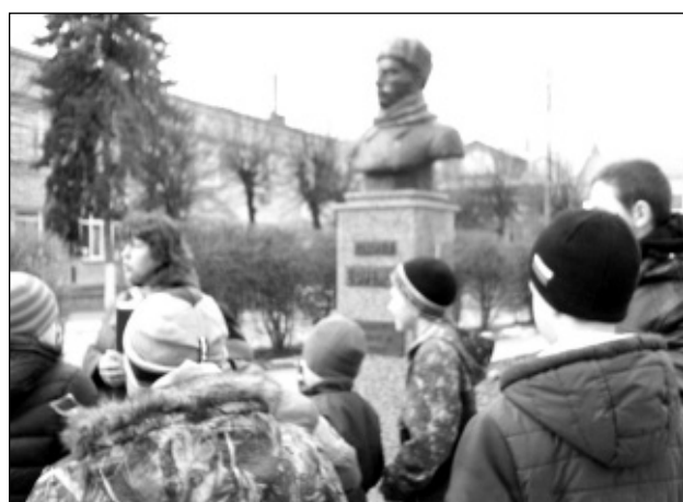
У памятника генералу М.Г. Ефремову.

Ефремову. Мы узнали о судьбах этих знаменитых людей. Всех ребят потряс подвиг героя-генерала. После экскурсии по городу мы посетили дом-музей семьи Цветаевых. Когда мы вошли внутрь, то увидели много инте-