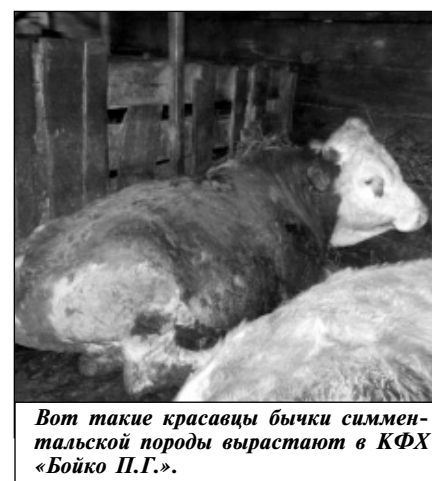
Вот такие красавцы бычки симментальской породы вырастают в КФХ «Бойко П.Г.»