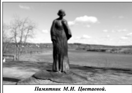
Памятник М.И. Цветаевой.

ресного: старинные фотографии на стенах, старинную, очень красивую резную мебель, ещё посуду, самовар, пианино, диванчик, который Цветаевы привозили с собой из Москвы на лето и увозили потом обратно. Нам рассказали и показали много интересного. Мы узнали о тра-