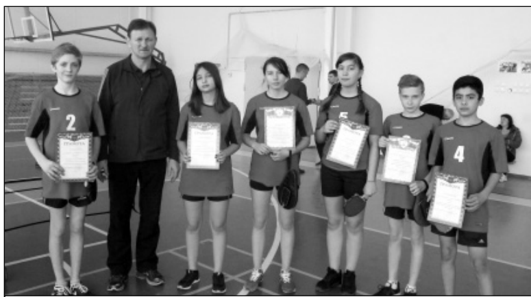
Команда МОУ «Мятлевская СОШ им. А.Ф. Иванова» - чемпион Износковского района.