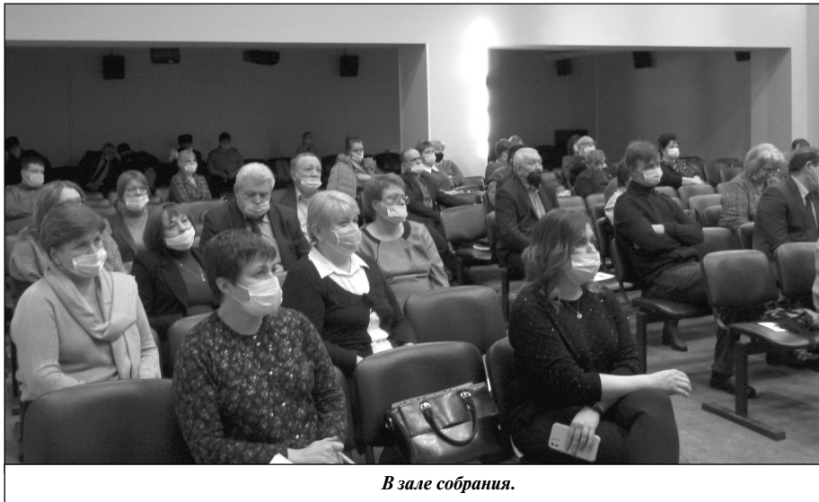
В зале собрания.

Объем ввода жилья на территории района за 2020 год составил 4 458 кв. м или 108,7 процента к заданию области.