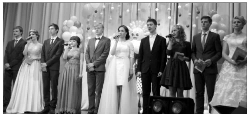
Свою трогательную прощальную песню, посвященную родной школе, учителям, исполняют выпускники Износковской школы.

Да они и были звездами, выпускники Износковского района 2017 года. Не раз заявляли они о себе на предметных