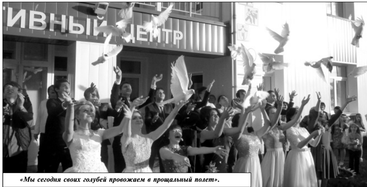
«Мы сегодня своих голубей провожаем в прощальный полет».