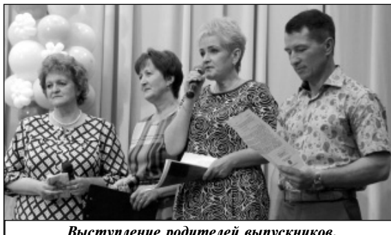
Выступление родителей выпускников.

Мы рассказали лишь о торжественной части выпускного бала. Но праздник продолжался до поздней ночи. Веселились все! А около полуночи в честь выпускников Износковского района 2017 года прогремел праздничный салют.