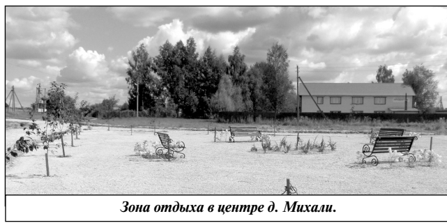
Зона отдыха в центре д. Михали.

ся. Насладиться красотами природы и отдохнуть от городской суеты в Михали приезжают семьи из Москвы и других городов России. Теперь ребятам будет, где с пользой проводить досуг и заниматься спортом. Для них построили площадку с игровы-