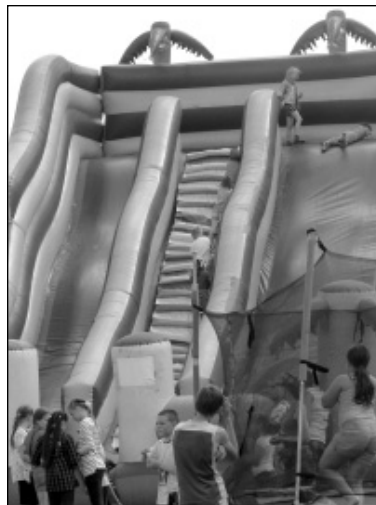
Детям на празднике было весело, батуты были самые разнообразные и даже такие огромные - надувные горы!

Особые слова благодарности за помощь в организации такого замечательного праздника были ад-