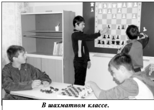
В шахматном классе.

ежедневно проводились музыкально-физкультурные зарядки и минутки здоровья, проходили подвижные игры на воздухе, спортивные состязания и эстафеты, направленные на сохранение и укрепление здоровья детей. Проведенные экскурсии, походы и массовые спортивные соревнования были направлены на сбережение и профилактику здоровья, они знакомили с историей нашего поселка, традициями и культурой. Дни были насыщены мероприятиями, творческими занятиями и развлечениями, такими как детская дискотека, походы в библиотеку, подвижные игры, спортивные праздники, «Веселые старты», викторины - всего не перечислить. Ребята, как члены трудового объединения «Муравей», ак-