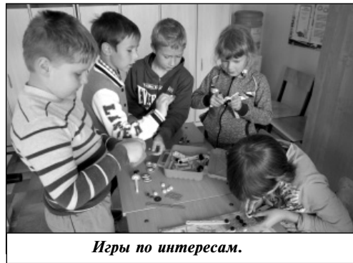
Игры по интересам.

В этом году наш детский оздоровительный лагерь продолжил работу по комплексной воспитательно-образовательной программе