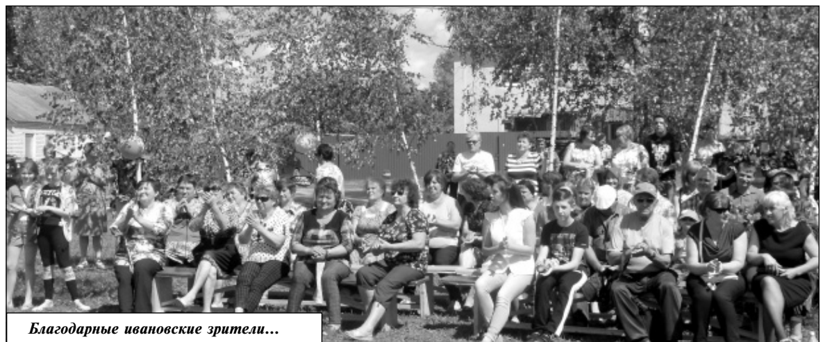
Благодарные ивановские зрители...