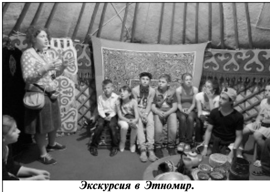
Экскурсия в Этномир.

Родимый край... Как ласка матери, как нежный зов её над колыбелью, теплом и радостью трепещет в сердце волшебный звук знакомых слов. Чуть тает тихий свет зари, звенит сверчок под лавкой в уголке, из серебра узор чеканит в окошке месяц молодой... Укропом пахнет с огорода... Родимый край... Ф. Крюков