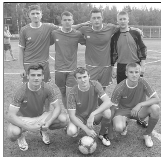
Футбольная команда «Олимп» Износковского района.