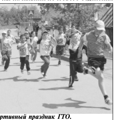
Спортивный праздник ГТО.

Путешествие по родным тропинкам открыло детям многие достопримечательности поселка Мятлево. Ребята познакомились с историей возникновения родного поселка, с историей школы и т.д. Они побывали в почтовом отделении, где узнали о профессиональной деятельности почтальона. Экскурсию провела выпускница Мятлевской школы начальник почтового отделения