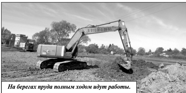
На берегах пруда полным ходом идут работы.

В планах администрации также оборудование у пруда автомобильной парковки, а в перспективе, по окончании работ, зарыбление водоема мальками из семейства карповых и непременно белым амуром, чтобы исключить в дальнейшем зарастание водоема водорослями. На сегодняшний день вся рыба, которая была в пруду до на-