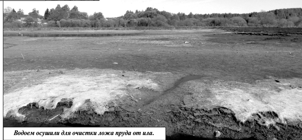
Водоем осушили для очистки ложа пруда от ила.

Перво-наперво ещё 20 апреля здесь приступили к очистке ложа пруда от иловых отложений. Надо сказать, что денежные средства в размере 1 млн 790 тыс. рублей на проведение этих видов работ были выделены из бюджета Износковского района. Специализированная техника уже выровнила и освобождает от кустарников берега пруда. На расстоянии 6-7 метров (а местами до 15) от берега экскаватором снимается многолетний слой ила, который грузится на машину и вывозится. Работа идет согласно заклю-