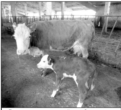
Вот каких крепышей рожают герфордские мамочки, а ведь теляночку только сутки.

Мы прошли на животноводческую ферму. Здесь светло и чисто, и только две коровки, отелившись лишь вчера, ходят по территории вместе со своими только родившимися телятами.