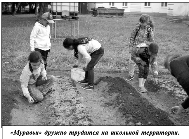
«Муравьи» дружно трудятся на школьной территории.