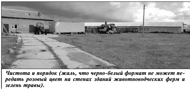
Чистота и порядок (жаль, что черно-белый формат не может передать розовый цвет на стенах зданий животноводческих ферм и зелень травы).

Конечно, сегодня у тружеников сельского хозяйства тоже немало проблем: высокие цены на топливо, технику и т.д., но работа продолжается. Отмечу, что на строительство убойного цеха ООО «Агрофирма «Шанский Завод»