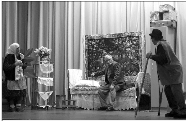
Фрагменты спектакля «Любишь - не любишь».