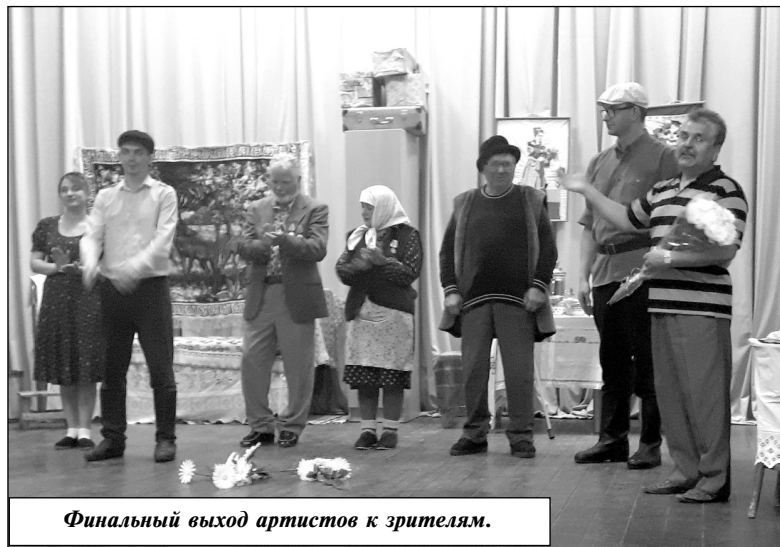
Финальный выход артистов к зрителям.