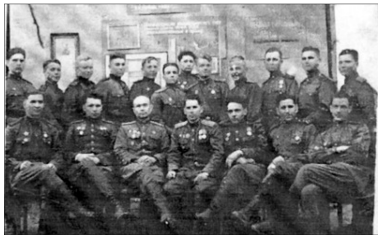
Офицеры танкового батальона. 12.04.1945 г.