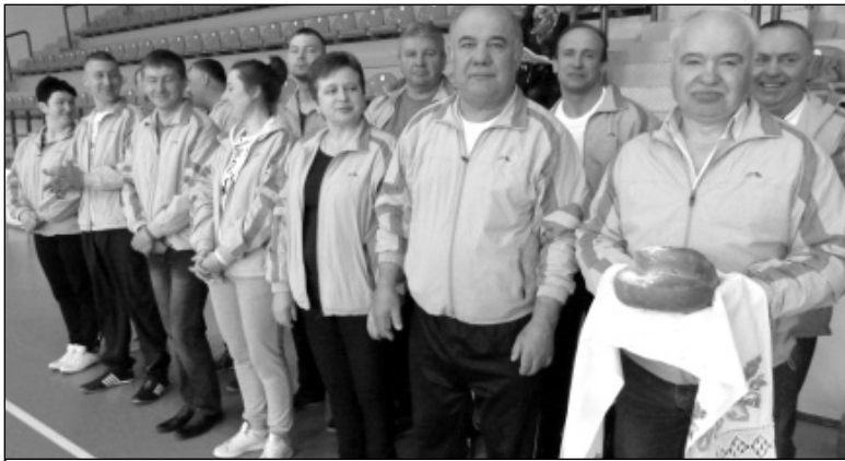
Хлебом и солью встречали спортивные команды организаторы соревнований.

Хотелось бы отметить, что инициатива проведения межрайонных спортивных соревнований среди администраций изначально принадлежит нашему Износковскому району. На протяжении пяти лет Износковская районная администрация организовывала данное спортивное межрайонное мероприятие на базе лесных угодий «Сафари-парк», которые находятся в де-