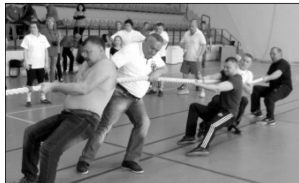
Последний этап соревнований - перетягивание каната потребовало от участников нашей команды больших усилий.

созданы все условия, а спортивные этапы прошли на высоком организационном уровне. Соревнования в Малоарославец длились целый день, каждый час был расписан по минутам, состязания проходили сразу по нескольким видам - благо, что недавно открывшийся физкультурно-оздоровительный комплекс «Планета Спорт»,