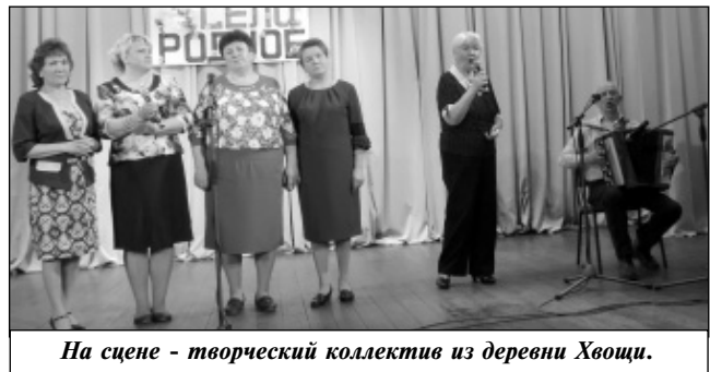
На сцене - творческий коллектив из деревни Хвощи.

ска, Шанского Завода, Алексеевки, Лынозавода, п. Мятлево. Все они представили не только музыкальные номера, но и выставки работ декоративно-прикладного творчества умельцев своего села.