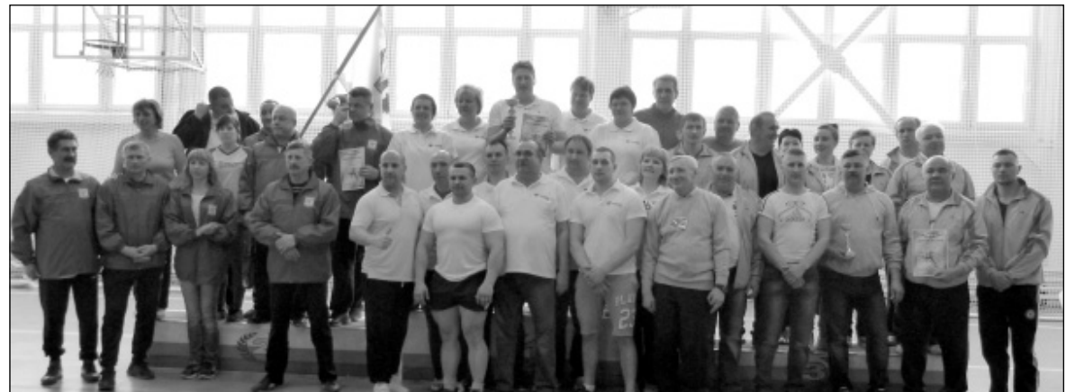
Снимок на память. Призеры соревнований: победители - команда администрации Малоарославецкого района (в центре), серебряные призеры - команда администрации Мосальского района (слева), бронзовые призеры соревнований - команда администрации Износковского района (справа).

впечатливший всех своим размером, современным оснащением и возможностями, это позволяет.