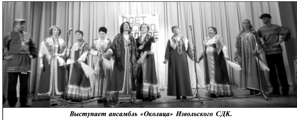
Выступает ансамбль «Околица» Извольского СДК.