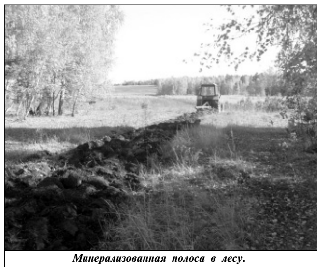
Минерализованная полоса в лесу.

ных лесничеств - «Зеленый парус» (Износковская средняя школа) и «Лесной дозор» (Шанско-Заводская средняя школа).