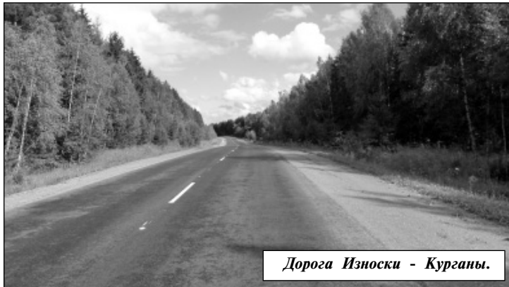
Дорога Износки - Курганы.

Расшифруем, из чего складываются расходы одной из основных статей. Текущее содержание улично-дорожной сети - это содержание дорог, тротуаров, дорожных знаков, пешеходных и дорожных ограждений, остановочных комплексов и прочих инженерных сооружений. А это