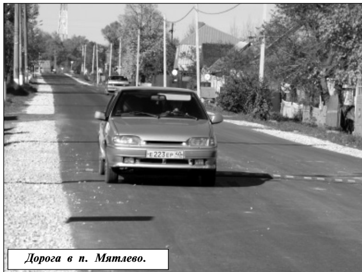
Дорога в п. Мятлево.

В 2013 году проведен капитальный ремонт дворовых территорий в с. Износки по ул. Мишурина, д. 1, 3, 5 и ул. Крупской, 42 (634 079 руб.).