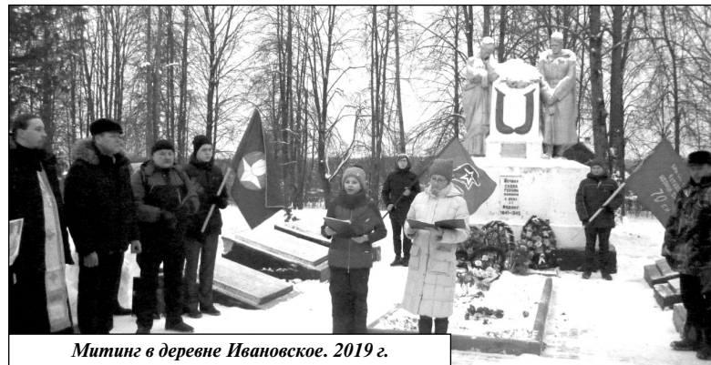
Митинг в деревне Ивановское. 2019 г.