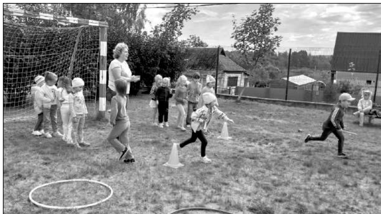
В дружбе со спортом. Занятия проводит М.А. Курбанова.