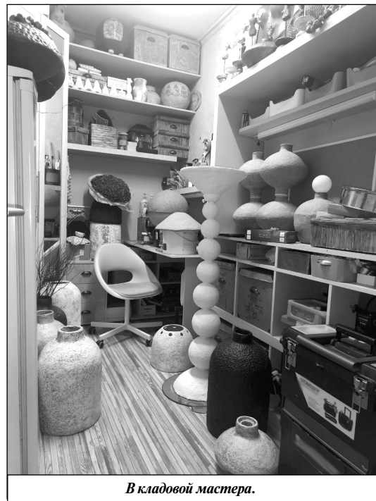
В кладовой мастера.