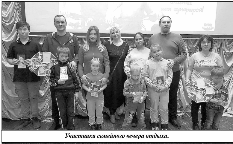
Участники семейного вечера отдыха.