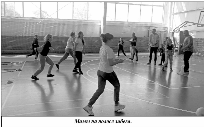
Мамы на полосе забег.