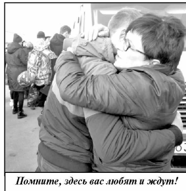
Помните, здесь вас любят и ждут!

Наступил самый трогательный момент - короткое, но проникновенное