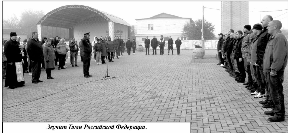
Звучит Гимн Российской Федерации.

Парни, с честью и достоинством выполняйте воинский долг и возвра-